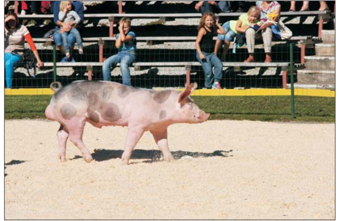
Foto 2. Pjeträani tõugu kult

2015. aasta läheb Eestis ajalukku sigade arvu väga järsu vähenemisega, mistõttu ETSAÜ oli sunnitud proportsionaalselt emiste arvu vähenemisega vähendama ka seemendusjaama kultide arvu 1/3 võrra. Õnneks müüdi mitmed head kuldid farmidesse, mitte lihatööstustesse, ja neid kasutatakse põrsaste tootmiseks edasi. Seemendus-