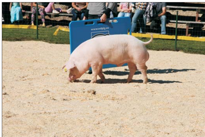
Foto 1. Eesti maatõugu kult